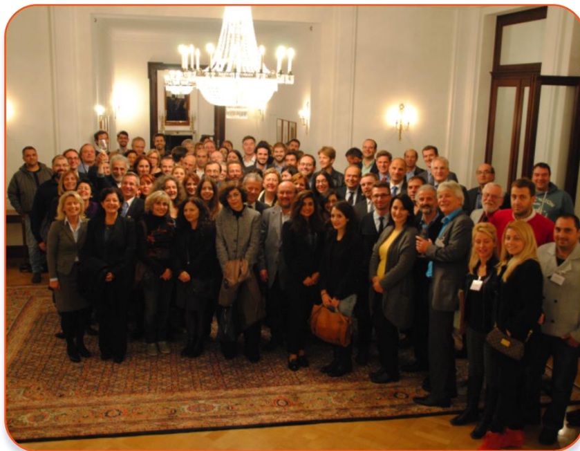
Οι συμμετέχοντες στο 1ο Ελληνογερμανικό Φόρουμ Νεολαίας κατά την επίσκεψή τους στην έδρα του Ποέδρου της ΟΔΓ στη Βόνη, στη Βίλα Χάμερσμιτ.

Από τις 3 έως τις 6 Νοεμβρίου 2014 διοργανώθηκε στο Μπαντ Χόνεφ κοντά στη Βόνη το 1 ο Ελληνογερμανικό Φόρουμ Νεολαίας. 120 φορείς και παράγοντες από την Ελλάδα και τη Γερμανία καθώς και εκπρόσωποι και των δυο κυβερνήσεων συναντήθηκαν τότε για να ανταλλάξουν εμπειρίες και να σχεδιάσουν μελλοντικά προγράμματα. Στο τέλος αυτής της τετραήμερης εκδήλωσης, που αποτελούνταν από διαλέξεις, εργαστήρια και ειδικές επισκέψεις στην περιοχή Κολωνίας/Βόνης, διαμορφώθηκαν δέκα ιδέες για προγράμματα με περιεχόμενο πολιτισμικής, πολιτικής και επαγγελματικής εκπαίδευσης καθώς και εκπαίδευσης για τη βιώσιμη ανάπτυξη και δραστηριοτήτων για νέες και νέους χωρίς διακρίσεις. Η IJAB e.V., η επίσημη υπηρεσία της Ομοσπονδιακής Δημοκρατίας της Γερμανίας για τη Διεθνή Συνεργασία για τη Νεολαία, συνοδεύει αυτές τις συνεργασίες που δημιουργήθηκαν στο Φόρουμ Νεολαίας για την υλοποίηση των προγραμμάτων και παρέχει συμβουλευτικές υπηρεσίες για τη δημιουργία νέων συνεργασιών.