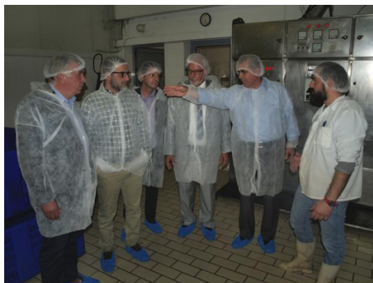
Εγκατάσταση παραγωγής ελιάς

Για μια πρώτη γνωριμία του ελληνικού Δήμου Κιλελέρ, ο Δήμαρχος Ερνστ Σίλινγκ επισκέφτηκε τον Οκτώβριο την Περιφέρεια της Θεσσαλίας. Η ιδέα αυτής της νέας συνεργασίας ήταν του Δημάρχου του Ετενχάιμ, κ. Μετς και του Δημάρχου Αγιάς, κ. Γκουνταρά στην 5 η Συνδιάσκεψη της Ελληνογερμανικής Συνέλευσης.