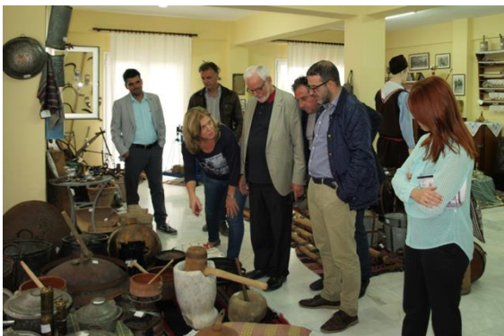
Στο Λαογραφικό Μουσείο του Κιλελέρ

Και η πώληση τοπικών προϊόντων, η ανάπτυξη της κοινοτικής διοίκησης καθώς και η ανταλλαγή νέων και τα προγράμματα προώθησης του τουρισμού αποτέλεσαν θέματα των συζητήσεων. Η επόμενη συνάντηση εργασίας θα γίνει στο Χερμπολτσχάιμ.