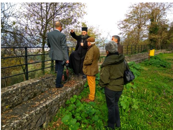
Ο Μητροπολίτης Μάξιμος εξηγεί τα σχέδια του για τη σχολή