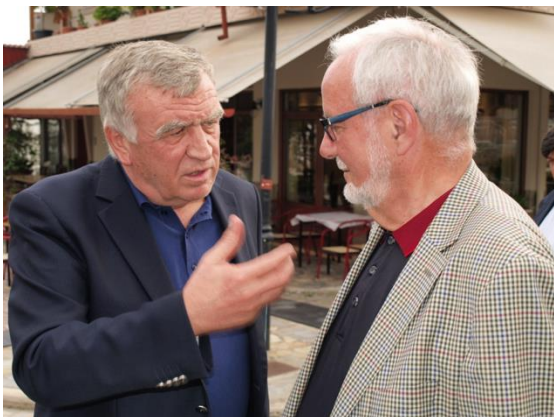
Οι Δήμαρχοι Αθανάσιος Νασιακόπουλος και Ερνστ Σίλινγκ