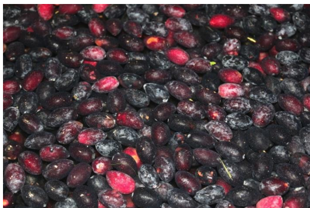
Ένας οδηγός προϊόντων θα φέρει κοντά παραγωγούς και πελάτες

Για να υλοποιηθούν αυτά τα σχέδια, στο επίκεντρο του ενδιαφέροντος για τον επόμενο χρόνο θα βρεθούν η βιοποικιλότητα, τα πολιτισμικά τοπία, τα περιφερειακά προϊόντα και ο ήπιος τουρισμός. Τόσο το πρόγραμμα των βοσκών όσο και η επαγγελματική σχολή στους χώρους της Μονής Βελλάς θα συνοδεύονται επιστημονικά από το Πανεπιστήμιο Ιωαννίνων και το ΤΕΙ Ηπείρου στην Άρτα. Μεταξύ των ΤΕΙ Ηπείρου και Βαϊενστέφαν γίνονται ήδη συνομιλίες για πιθανές συνεργασίες. Σχεδιάζεται η επίσκεψη Ελλήνων φοιτητών αγροτικής οικονομίας στο Βαϊενστέφαν το καλοκαίρι του 2017. Και στον αγροτικό τομέα υπάρχει η δυνατότητα της δυαδικής επαγγελματικής εκπαίδευσης για νέους.